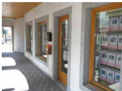
PIEVE DI BONO-PREZZO