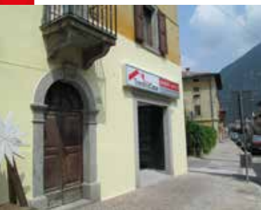
TIONE DI TRENTO